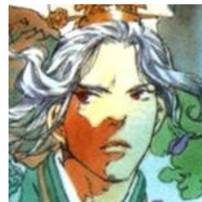
Sạ Kiêu Tông