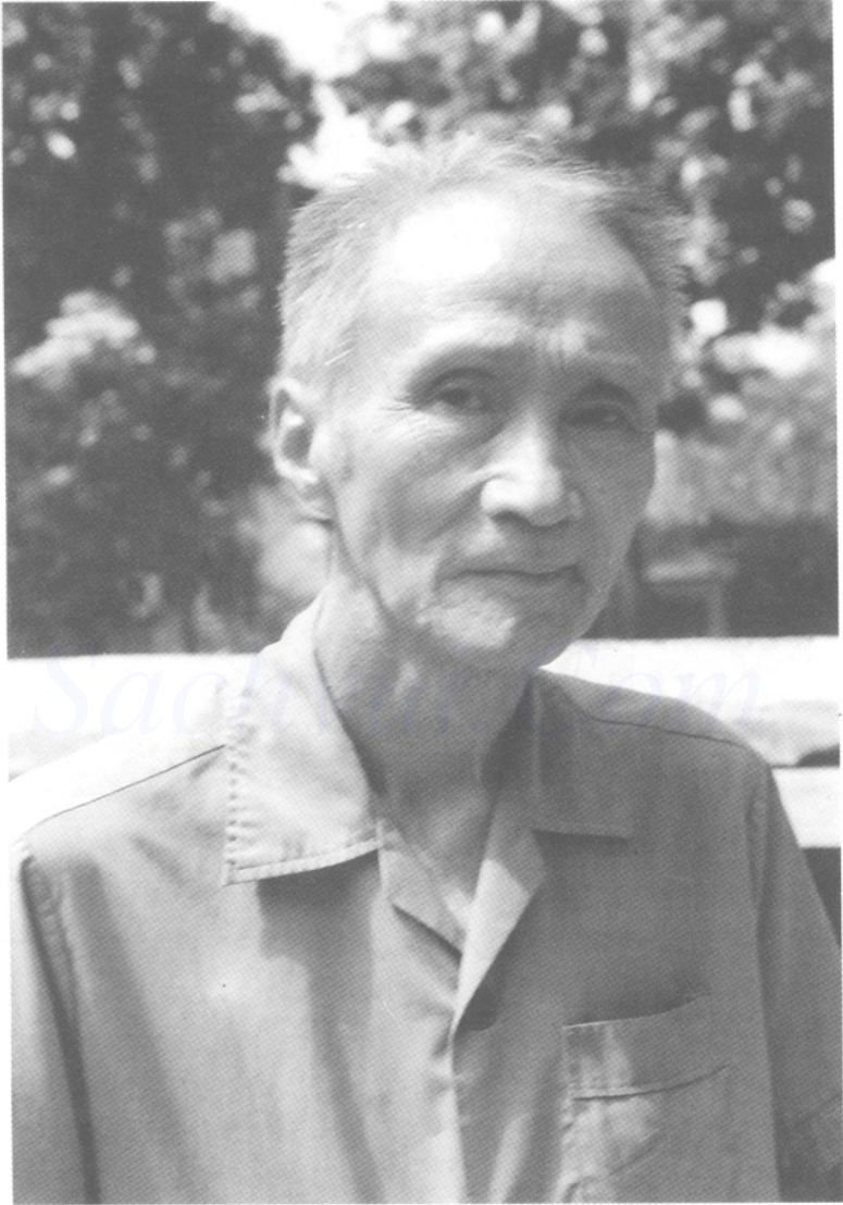
Nguyễn Khắc Viện (1913 - 1997)