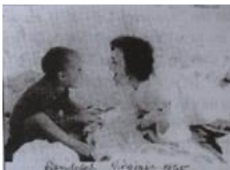
Mẹ và tôi trên bãi biển

Theo một cách nào đó, với sự trôi đi của thời gian, và những mốc hẹn mà cuộc sống áp đặt, đầu hàng đôi khi là việc đúng đắn nên làm.