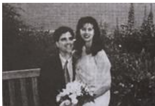
Ảnh chụp trước khi chúng tôi lên khinh khí cầu.

Người lái khinh khí cầu cho bốt không khí ra. Ông kéo tất cả cần gạt, chỉ muốn hạ xuống thật nhanh. Lúc đó, tốt hơn là ông cho va vào một ngôi nhà gần đó thay vì va vào đoàn tàu đang chạy nhanh.