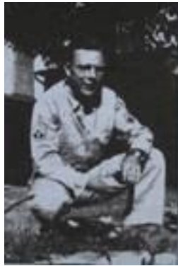
Cha tôi trong bộ quân phục

một bài học của cha tôi về ý nghĩa của sự hy sinh và về sức mạnh của lòng nhân đạo.